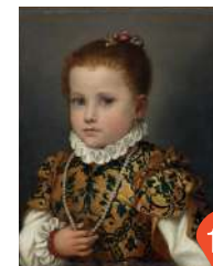
Giovan Battista Moroni