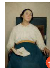
Giuseppe Pellizza da Volpedo